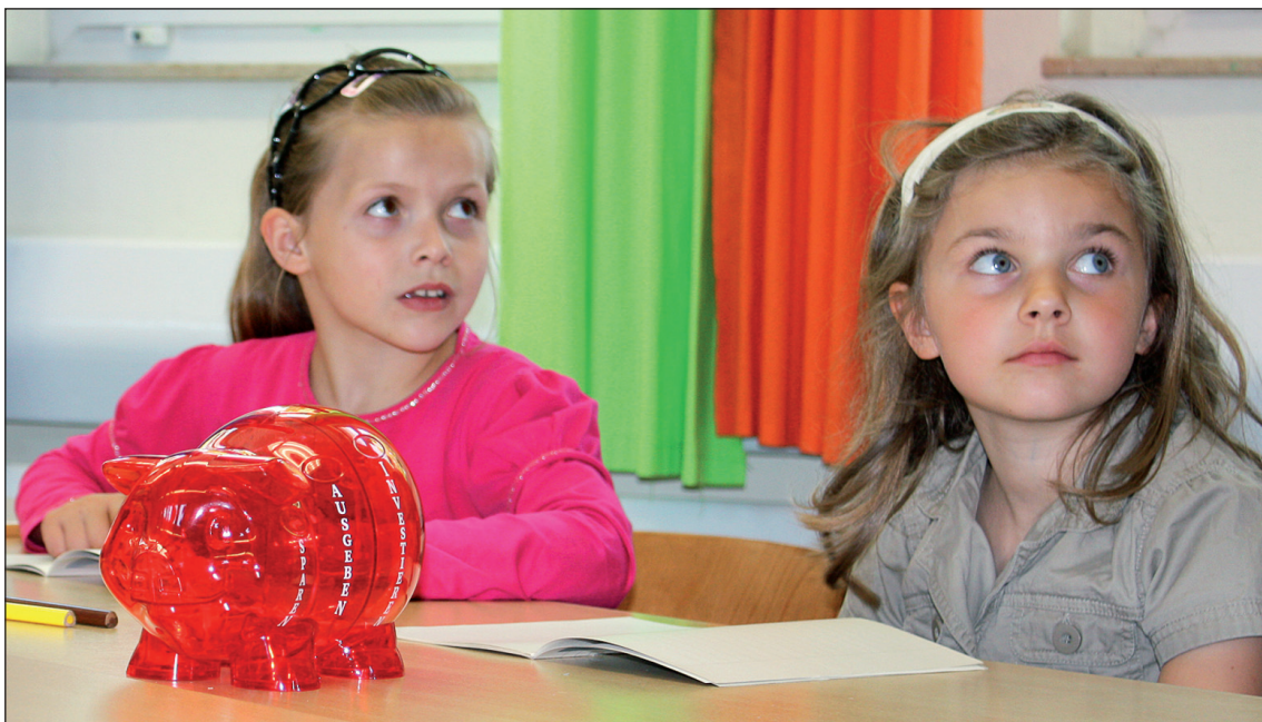
Kinder-Cash a été conçu initialement pour prévenir les comportements à risque liés à l'endettement.