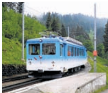
Die Rigi-Bahnen AG braucht neues Kapital für ihre Grossvorhaben.

Um die 17 Millionen teuren Bahnhofneubauten in Goldau und Rigi-Kaltbad finanzieren zu können, braucht die Rigi-Bahnen AG zusätzliches Geld. Auf der jüngsten Generalversammlung haben die Aktionäre deshalb die Geschäftsleitung und den Verwaltungsrat beauftragt, das Aktienkapital um maximal 2 Millionen Franken zu erhöhen. Der Verwaltungsrat kann bis zum 9. Juni 2011 von dieser Möglichkeit Gebrauch machen. Gesamthaft kann er 400 000 Namenaktien im Nennwert von 5 Franken emittieren. Erhöhungen auf dem Weg der Festübernahme sowie solche in Teilbeträgen sind gestattet. Der Verwaltungsrat legt den Zeitpunkt der Ausgabe von neuen Aktien, den Ausgabebetrag, den Beginn der Dividendenberechtigung und die Art der Einlagen fest.