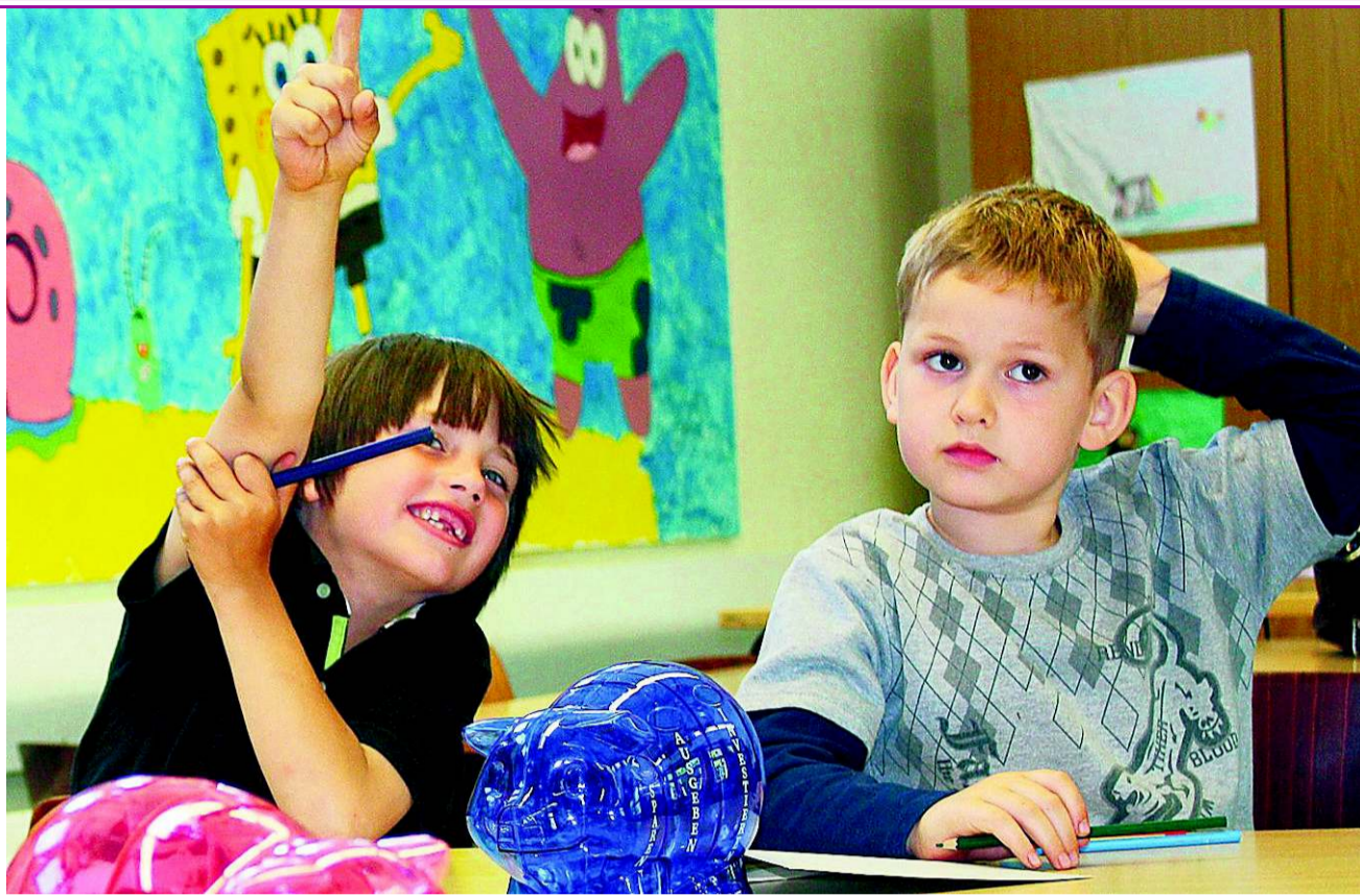
Kinder, die einen Teil ihres Taschengeldes ins Sparschwein werfen, können sich grössere Wünsche erfüllen.

Schick uns eure Game-Tipps an: kinder@sonntagonline.ch