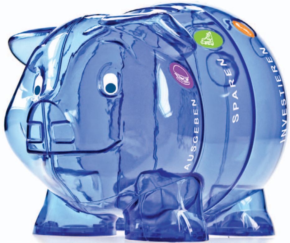
Blau, durchsichtig und lehrreich: Dieses Plastik-Sparschwein soll Kindern den bewussten Umgang mit ihrem Taschengeld beibringen.