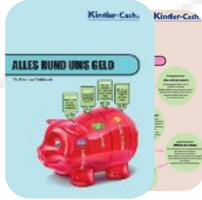
Elternheft 4-14 J.