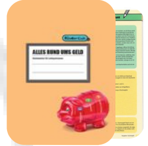
Lehrperson 9-12 J.